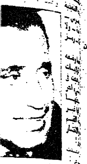
شاعر الاقطار العربية خليل مطران

ايقوشكين : ان الالتزام الاجتماعي هو ورقة مباد الشمس التي تسادد نسي تحديد اصالة الوجهة ما ريك حول ذلك ؟ برونسيسكي : ان الالتزام الاجتماعي هو مفهوم واسع ، ويشتمل على كل الحركات والطرق على كوكبا الارض ، ينبغي ان تترك قلب الكاتب ، كل شيء من الطروق الشعر الى الطريق الكوني العام ربما هذا هو خيال فيه كثير من الغرور والتبرج ، ولكننا هنا مهتمون بمسؤولية الكتاب تجاه قدر الجيوس البشري ، الابيه وترجمه منحه وجزئه ان من الصعب تصور شاعر حقيقي تنصه هذه المسؤولية بنضه التسعور بالمشارة في كل شيء ، بحيث في العالم فن القات ، حسن هذا القياس ، فنجم بكل البشرية لا تهم بالاعتكاف على المجلات والامسال الانسانية كتراد ، ان كدي صديقا لا ينشر بالشفقة تجاه اولئك المحيطين به ، ولكنه